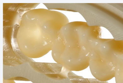
PMMA for brain®